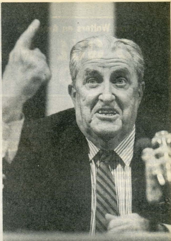
General Vernon Walters

Este general -que guió el ojo para que la dictadura de Galtieri ocupe las Malvinas, prometiendo la neutralidad de EEUU a cambio de la intervención directa de la Argentina en Centroamérica- vino con otras preocupaciones pero con objetivos similares: acatamiento a las potencias del