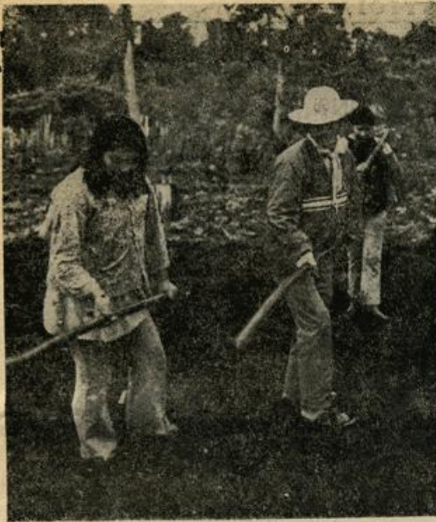
TRABAJANDO EN JEJUI