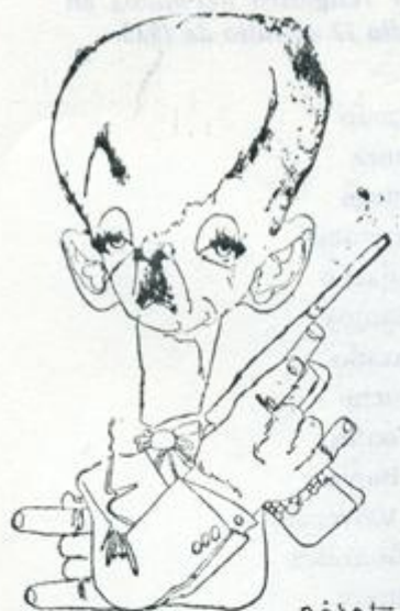
HUGO BANZER SUAREZ, presidente de Bolivia.

(Ver documento N° 8 del discurso del Gral. Banzer que se transcribe en "La Masacre del Valle, en este boletín).