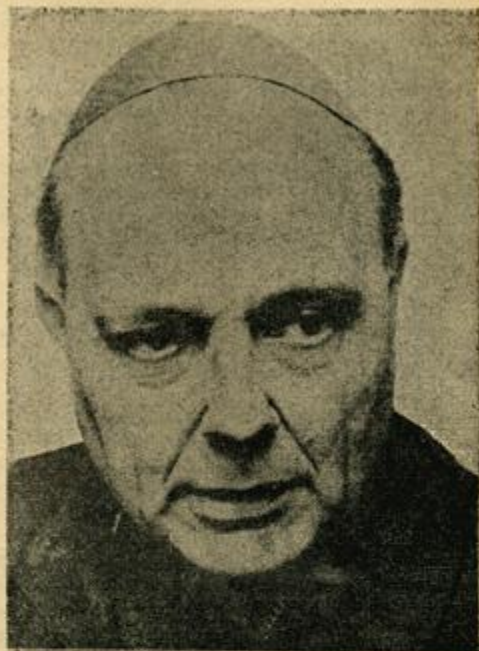
Cardenal Francisco Raúl Primatesta. En nombre de la CEA, su nuevo Presidente dio a conocer la Carta Pastoral.

El Estado no puede renunciar a su deber de ejercer la autoridad legítima y necesaria, aun en el plano coercitivo, aunque por otro lado en la sociedad cada uno debe conservar su libertad, en la medida en que ésta no cause riesgos de perjuicio al bien común. Porque, en definitiva, el