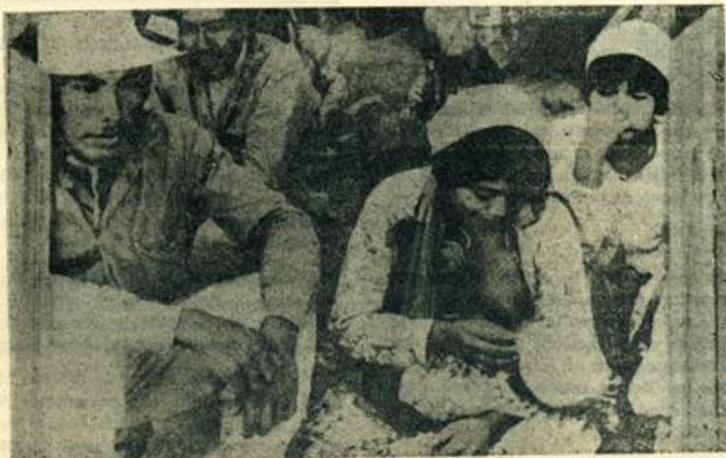
La desocupación arrastra a poblaciones enteras a la miseria, al hambre, la mortandad infantil, etc.

—ir más allá del liberalismo: el "libre cambio"