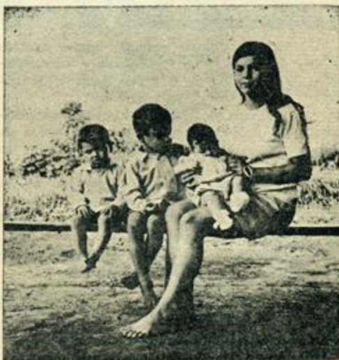
Indígena - Paraguay