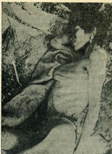
Así "viven" millones de latinoamericanos

Con relación a esto, dirá Pablo VI: "estamos en el cruce de un cambio decisivo de la historia de la humanidad", sobre el escenario del mundo se presentan pueblos "que se esfuerzan por escapar del hambre o de la miseria, de las enfermedades