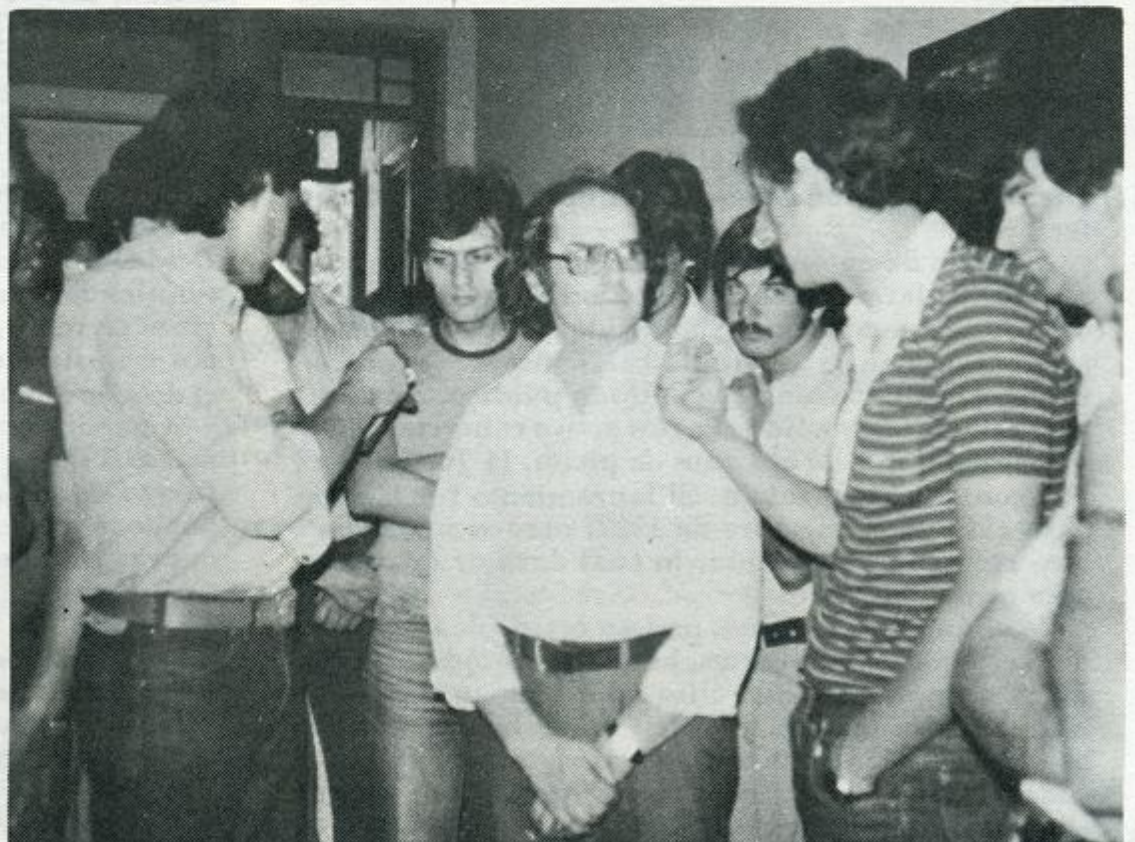
El Coordinador General Latinoamericano del SERPAJ visita a los obreros de FUNSA

Estuvo al frente del SERPAJ en América Latina desde sus orígenes y fue responsable de la reunión realizada en 1968 en Montevideo en la cual se gestó el Servicio.