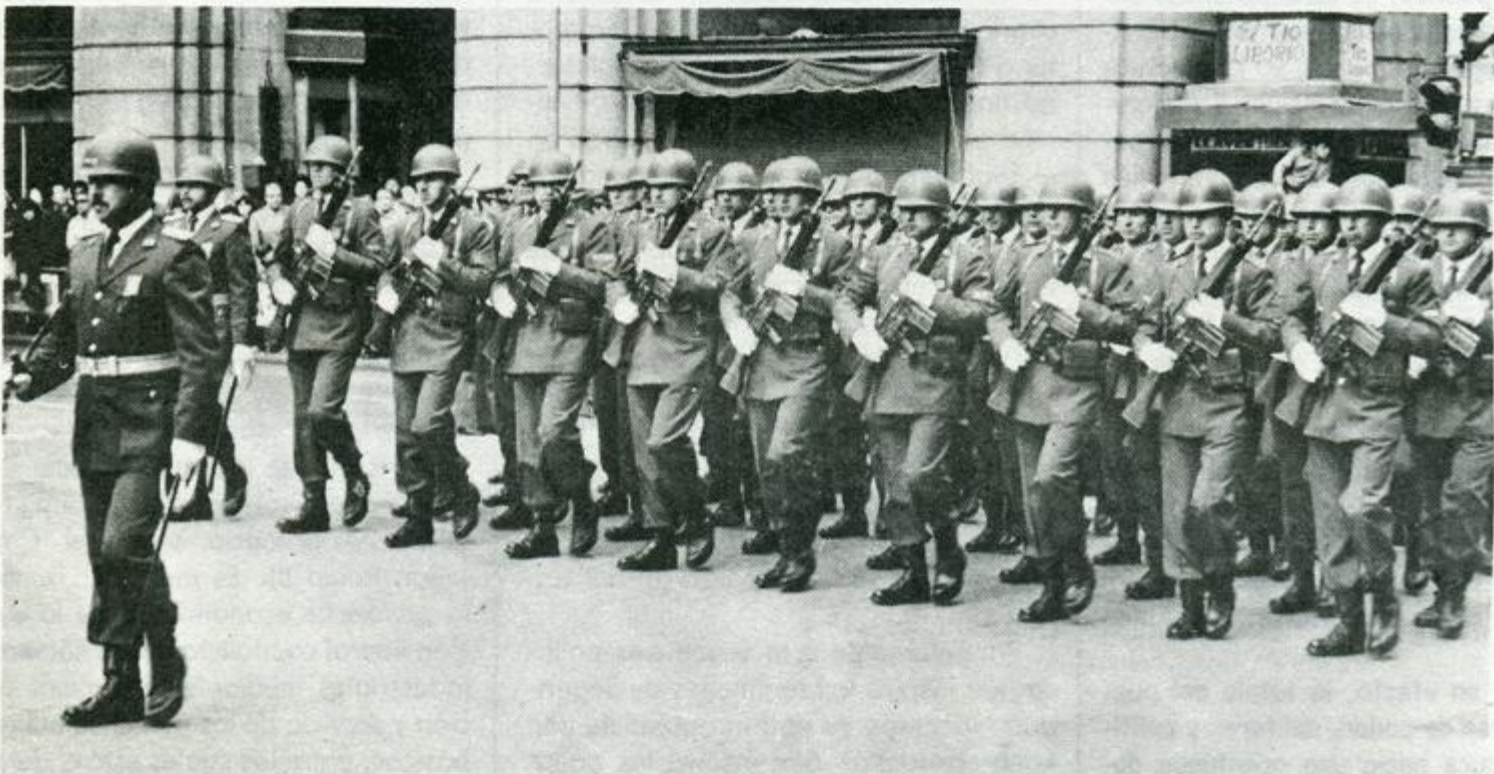
Juan Pablo II: "Restaurar la verdad es ante todo llamar por su nombre los actos de violencia bajo todas sus formas"

La «Alianza para el Progreso» fue un intento de promover un desarrollo conjugado, tanto económico como social, de las naciones dependientes de la metrópoli norteamericana, pero su lamentable fracaso dejó como único saldo un fuerte anti-marxismo extendido a todo progresismo social y político. De allí nace la teoría del mesianismo de las